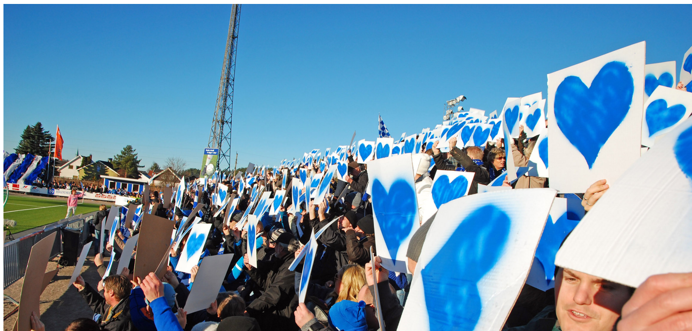
Det vedtas å bygge mobil sittetribune på Sarpsborg stadion med plass til ca 1.000 tilskuere.

Det første bystyret gjør i 2010 er å vedta etablering av en mobil tribune på Sarpsborg stadion med anslagsvis 1.000 sitteplasser. Utgiften var beregnet til 2,5 millioner kroner.