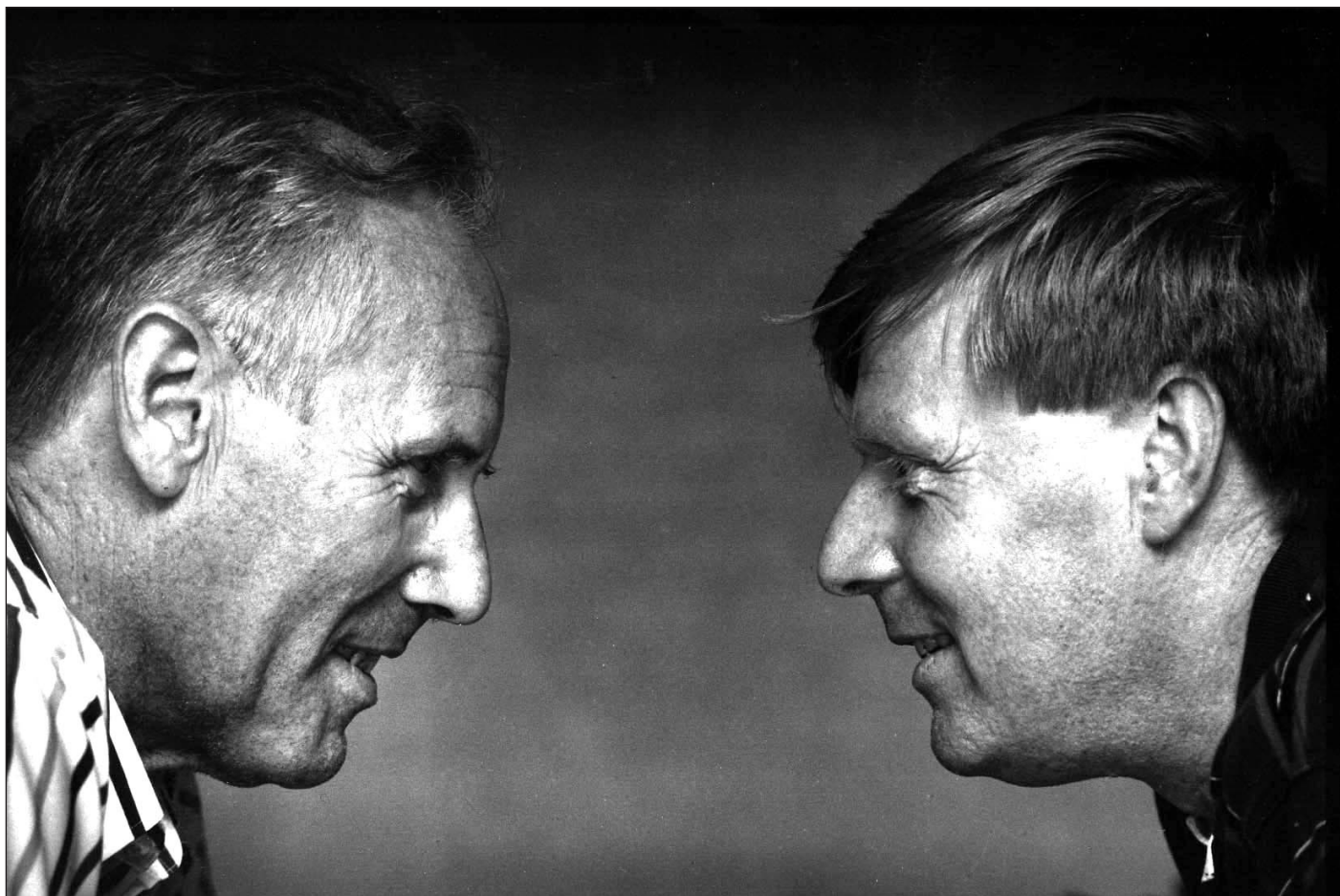
Valgkamp: Arbeiderpartiets Thorvald Gressum og Høyres Per Olaf Toftner.

kommunene ble også strøket, ja, velgerne brukte flittig retten til å foreta strykninger og kumuleringer. Dette førte bl.a. til at Varteig med sine drøye 2.000 innbyggere og 4,7 prosent av befolkningen fikk nær 19 prosent av representantene i det nye bystyret. Men frammøtet ved valget var det laveste siden allminnelig stemmerett ble innført i 1913 – bare 56,3 prosent.