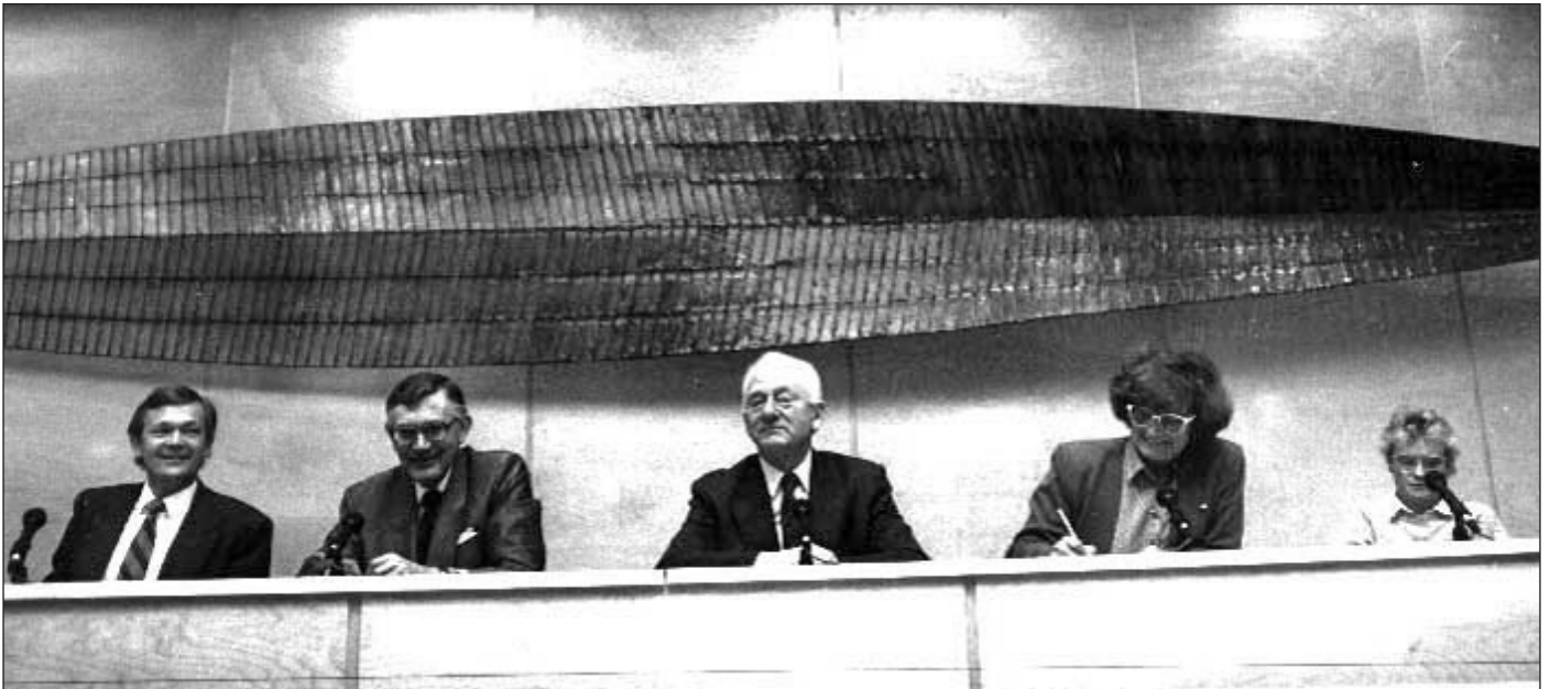
Buvik-utvalget la fram sin innstilling om sammenslåing 15. desember 1989.

Varteig, som fra det øyeblikk sammenslåingen var et faktum, fikk høyere kommunale avgifter. Fra nå skulle disse være like for alle. Kommunen ble for øvrig ikke inndelt i kommunedeler, slik at alle innbyggere var sikret den samme tjenesten. I ettertid er det nok en påstand med hold i at det var nettopp dette som gjorde at sammenslåingen ble vellykket.