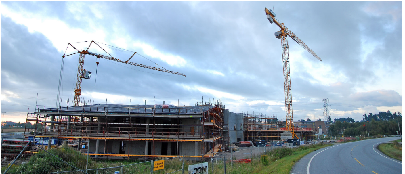
Tomt stilles til disposisjon for bygging av vitensenter på Grålum.

Rådmannen får fullmakt til å gjennomføre omgjøring av dobbeltrom til enkeltrom ved Sarpsborg sykehjem. Sarpsborghallen skal rehabiliteres for 28 millioner kroner. Plan for psykisk helse 2007 – 2010 godkjennes. Det vedtas å etablere NAV i Sarpsborg. Bystyret ønsker ikke å etablere boligsoneparkering i Sarpsborg. Investeringene til nye Grålum ungdomsskole må økes til 187 millioner kroner. Prisstigning og nye behov ved skolen er årsaken.