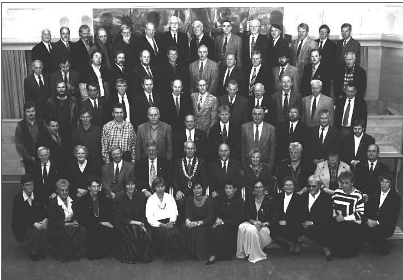
Det første bystyret i den nye kommunen.