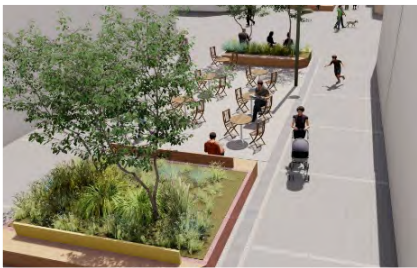
- Nils Hønsvaldsgate