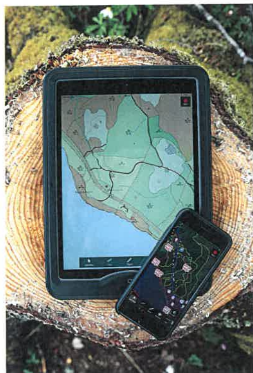
Allma på mobiltelefon og nettbrett

Som Allma-bruker får du fri tilgang til ressursoversikten på mobil eller nettbrett. Dermed kan du ta med ressursoversikten ut i skogen. Både nettbrett og mobiltelefoner har GPS. Den mobile utgaven av Allma kan lastes ned som en App. Den har stort sett den samme funksjonaliteten som web-versjonen.