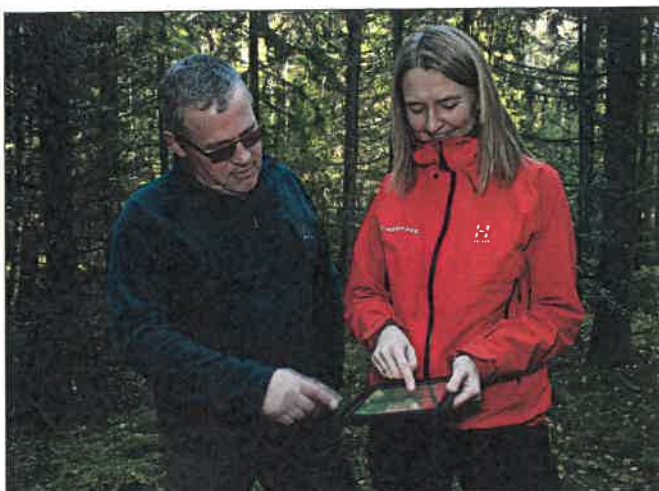
Allma egner seg meget godt til bruk ute i skogen

Årlig abonnement er kr. 400,- pluss en arealavhengig pris pr dekar. Den er kr. 0,35 for de første 1 000 dekar, kr. 0,25 for de neste 9 000 dekar og kr. 0,15 pr dekar for arealer som er over 10 000 dekar.